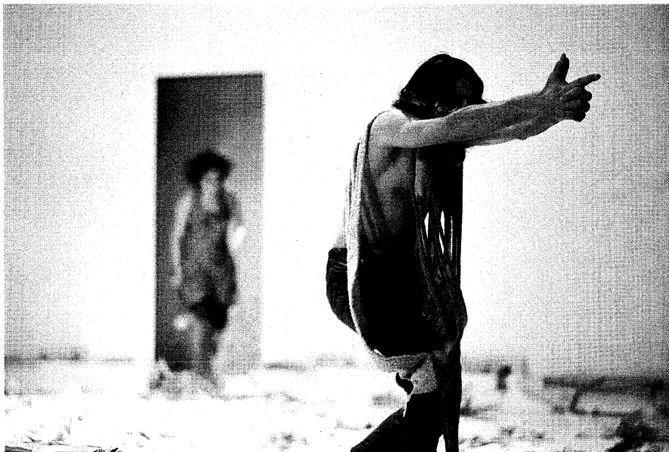
Een scène uit The assassination of Omar Rajeh door het Maqamat Dance Theatre uit Libanon.