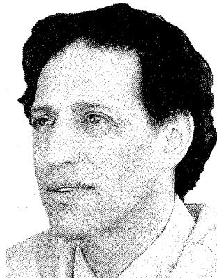
G. Feingold

Tot en met 13 december in Amsterdam, Groningen, Den Haag, Utrecht en Rotterdam. Inlichtingen: www.dancingontheedge.nl .